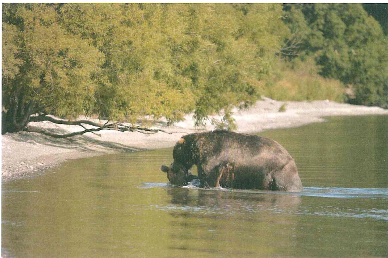
3. Камчатский бурый медведь.