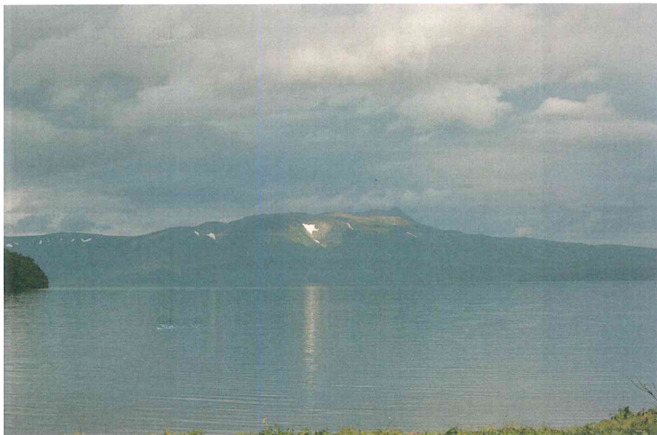
4. Курильское озеро.