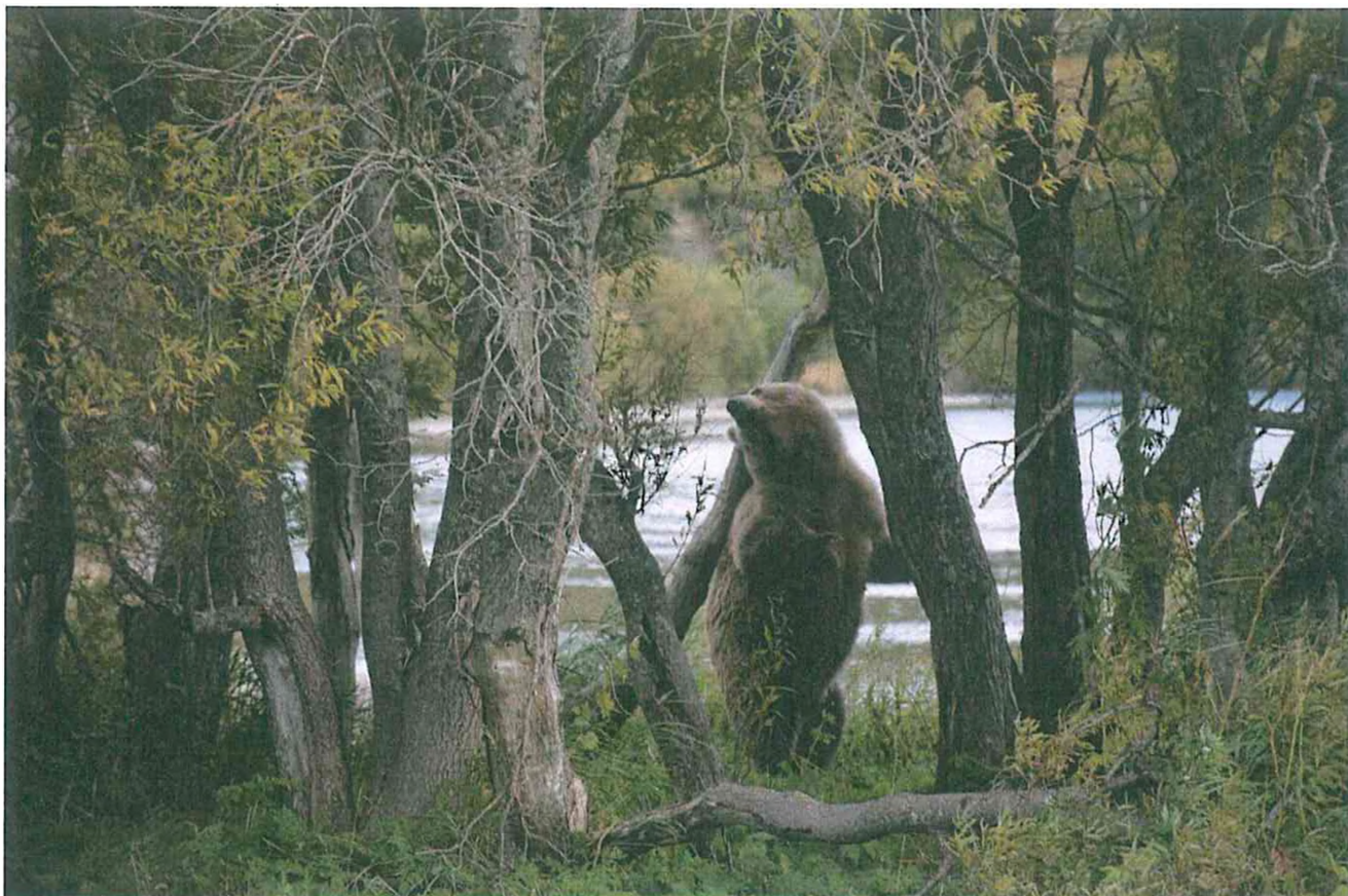
2. Камчатский бурый медведь.