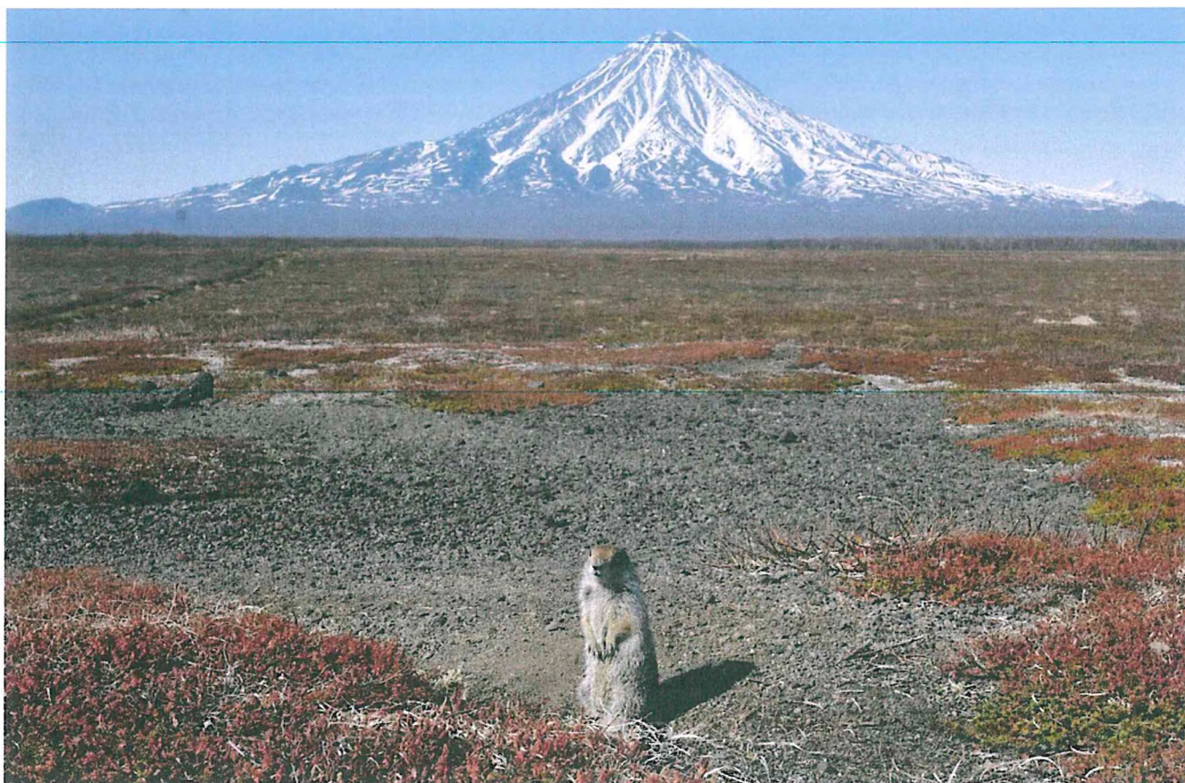
1. Кроноцкий вулкан.