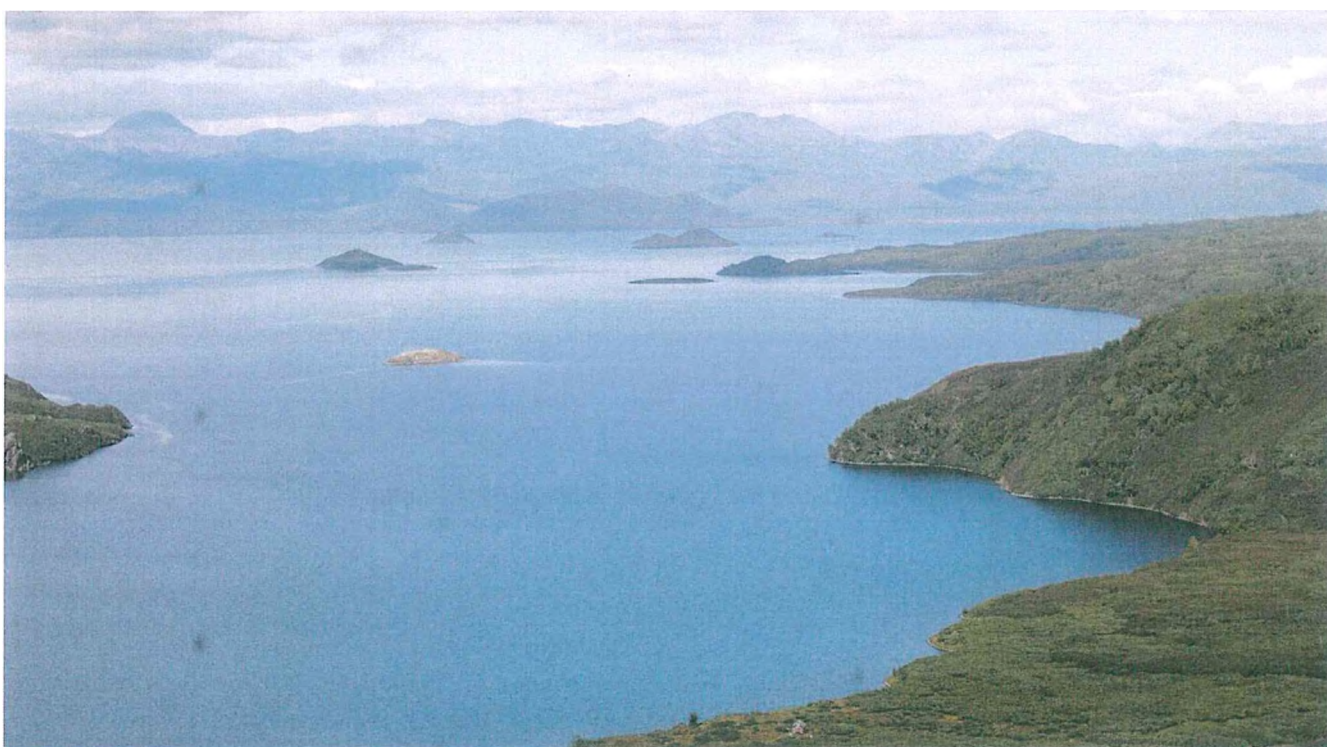
2. Кроноцкое озеро.