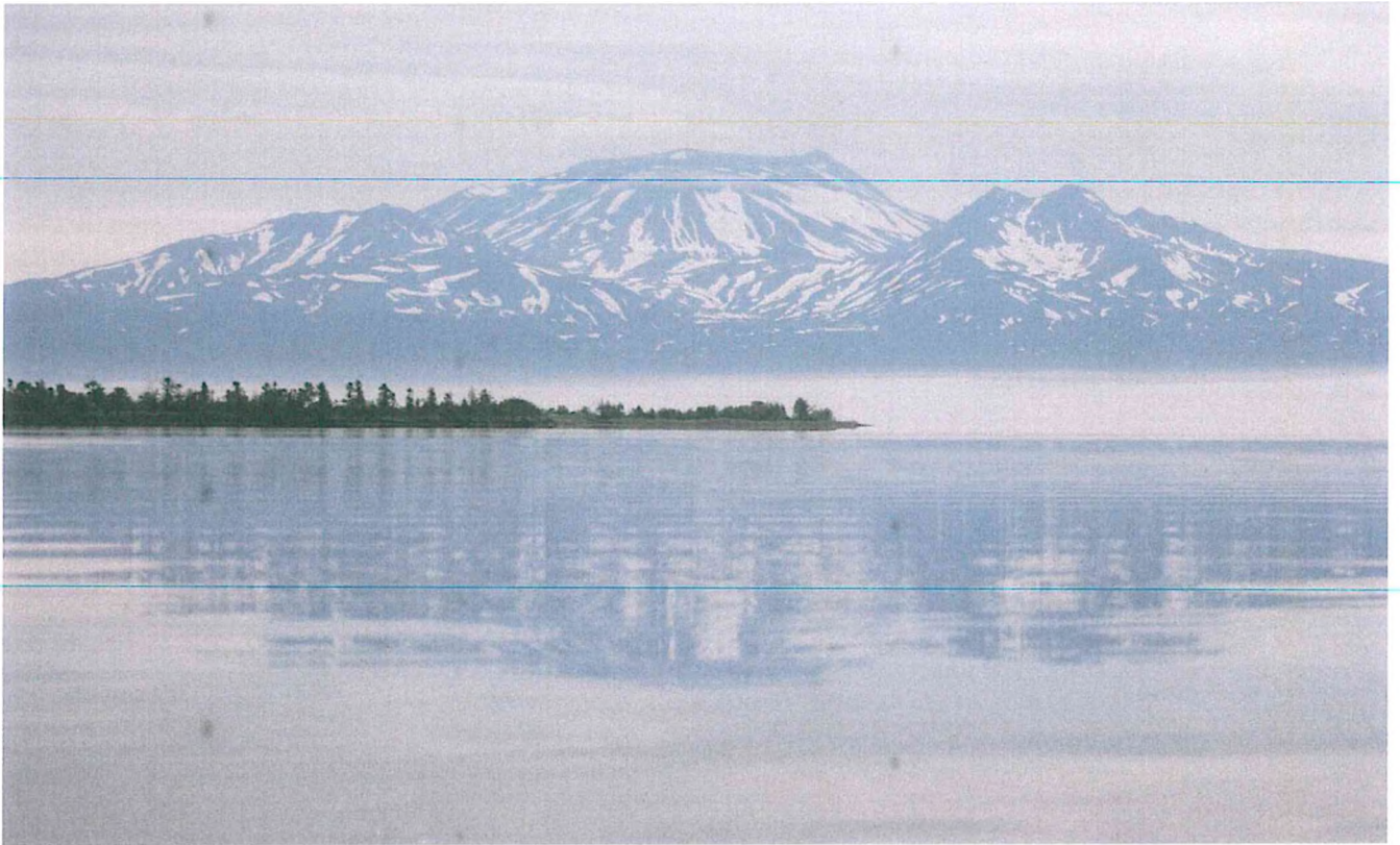
3. Кроноцкое озеро.