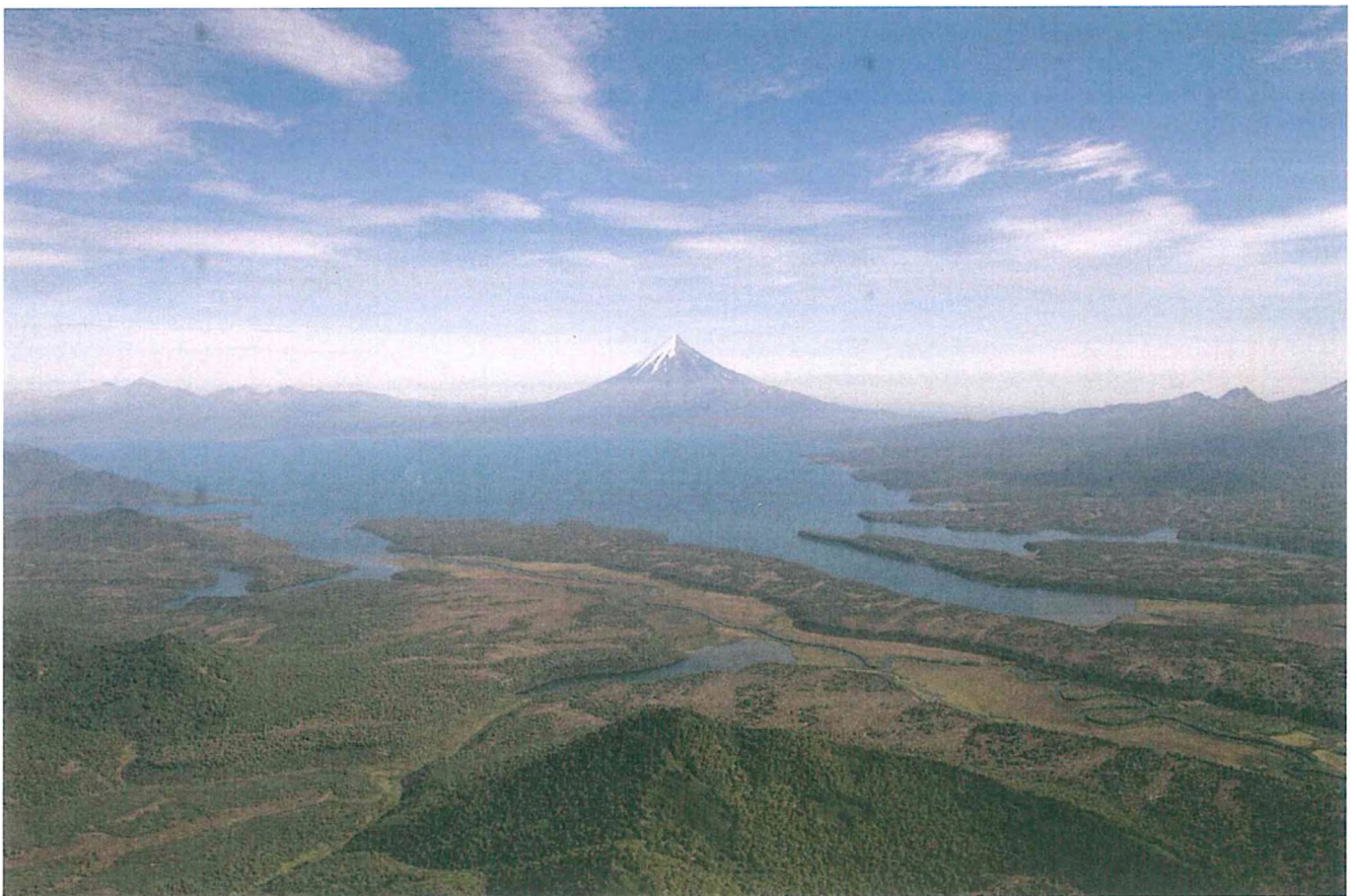
4. Кроноцкий вулкан и Кроноцкое озеро.