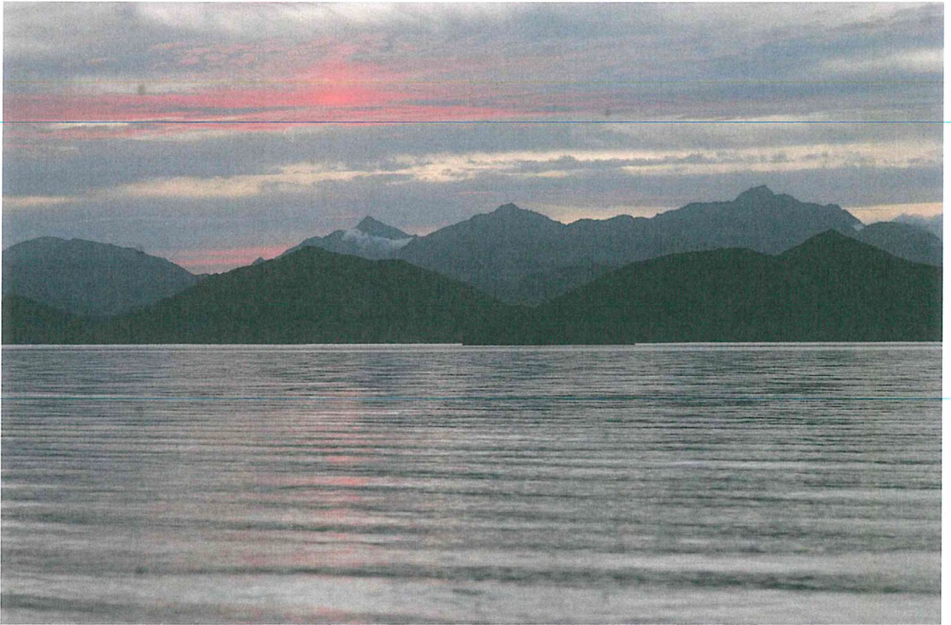
5. Кроноцкое озеро.