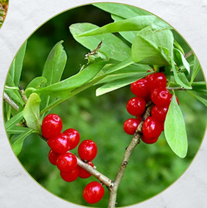
Волчник камчатский (волчья ягода)