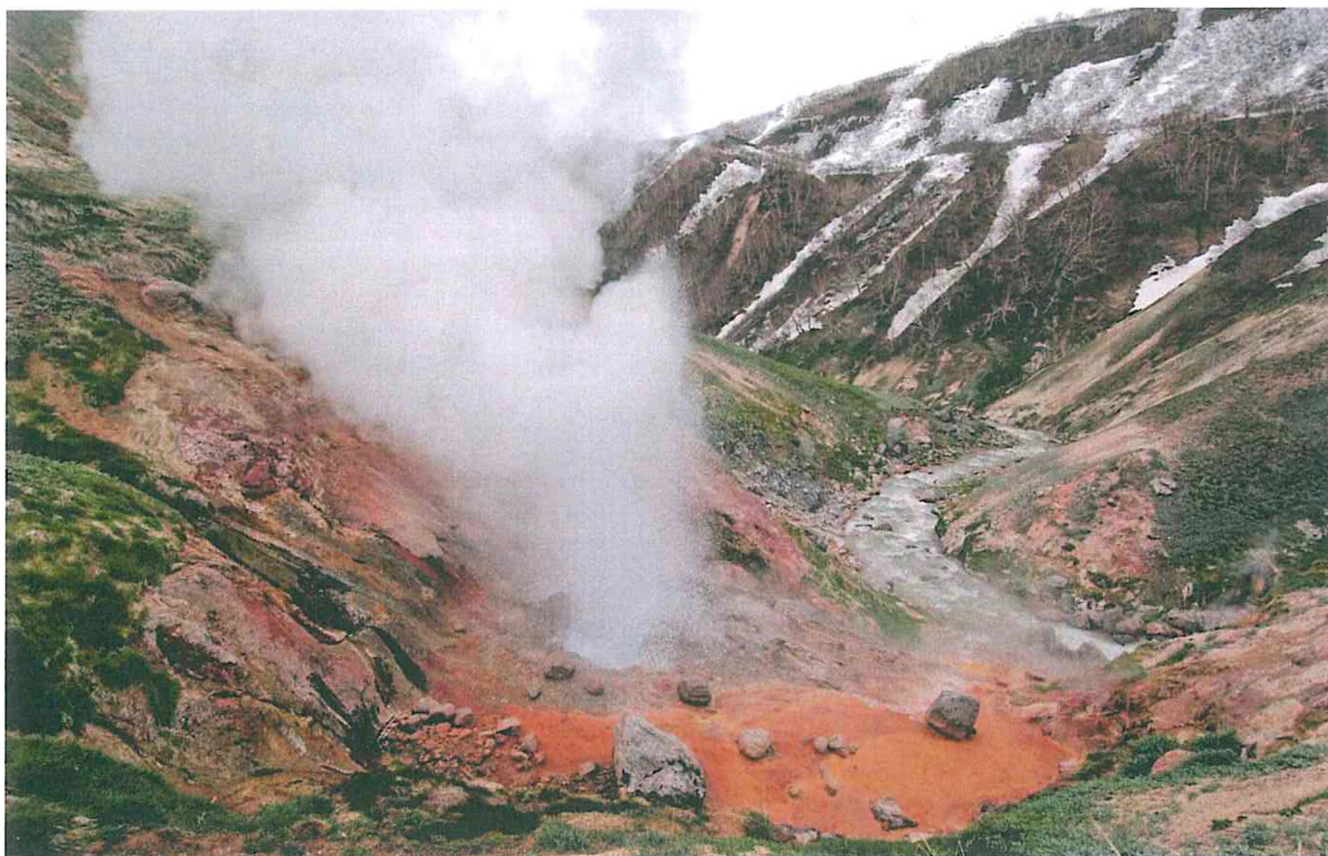
1. Гейзер в Долине гейзеров.