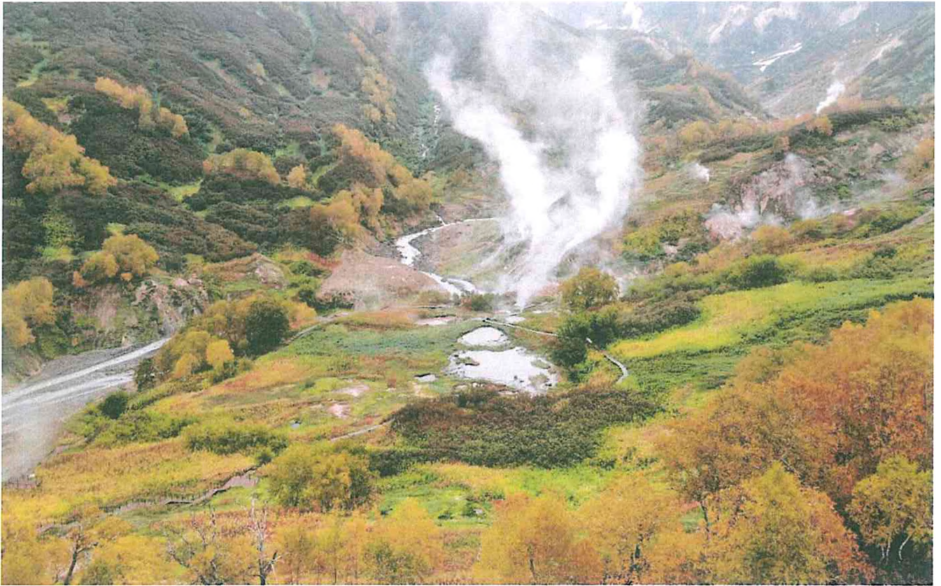
5. Долина гейзеров, площадка водных и грязевых котлов.