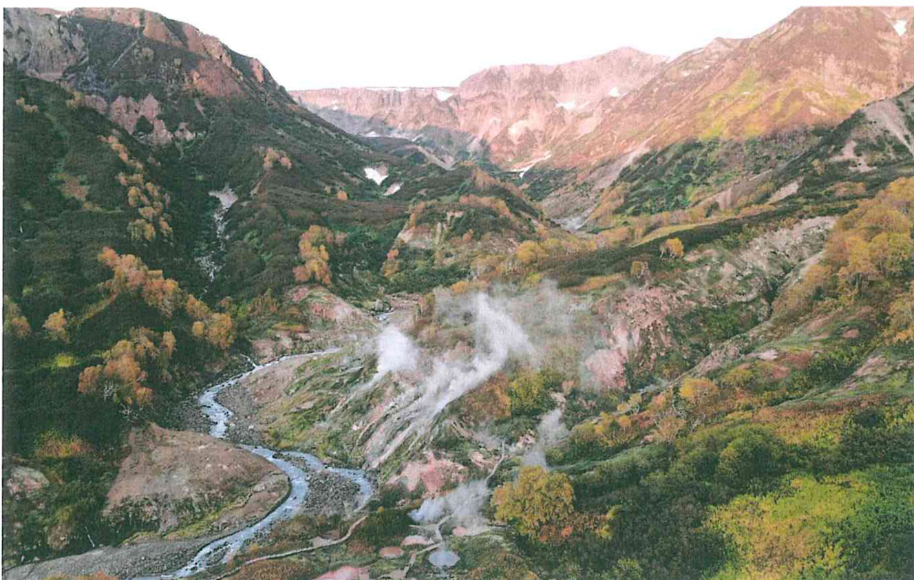
2. Долина гейзеров, термальный склон Витраж.