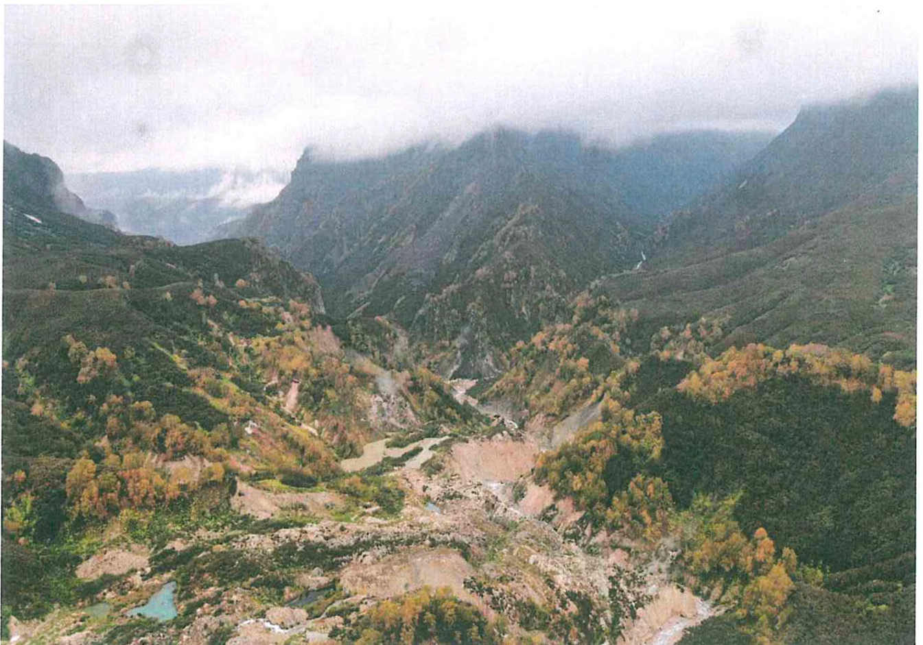
4. Долина гейзеров, оползень 2007 года.