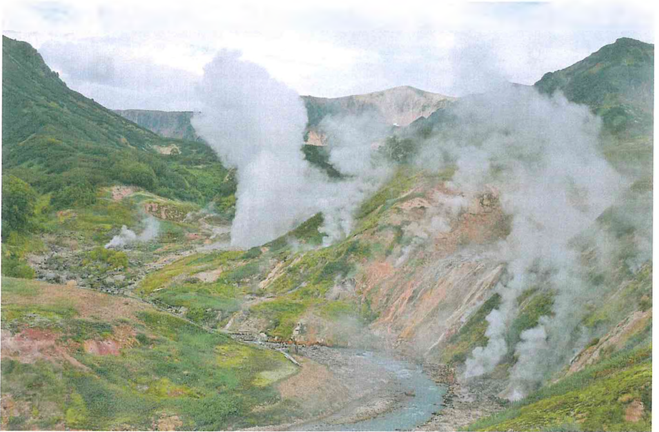
3. Долина гейзеров, река Шумная.