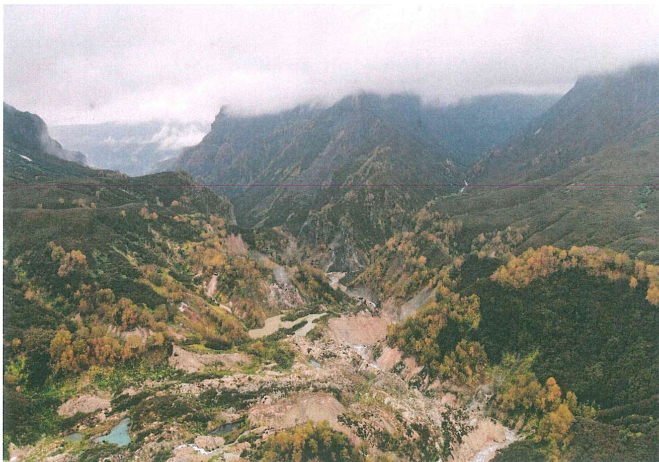
2. Долина гейзеров. Фото А. В. Маслов