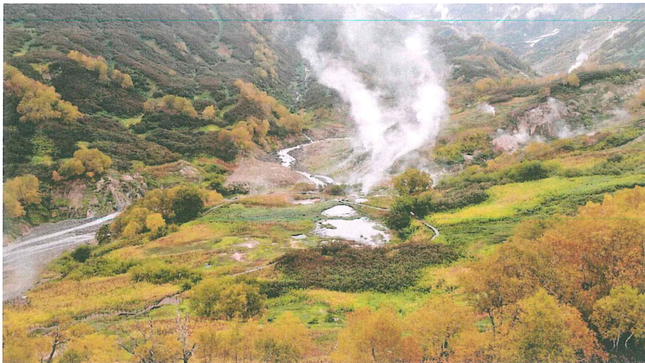
1. Долина гейзеров.