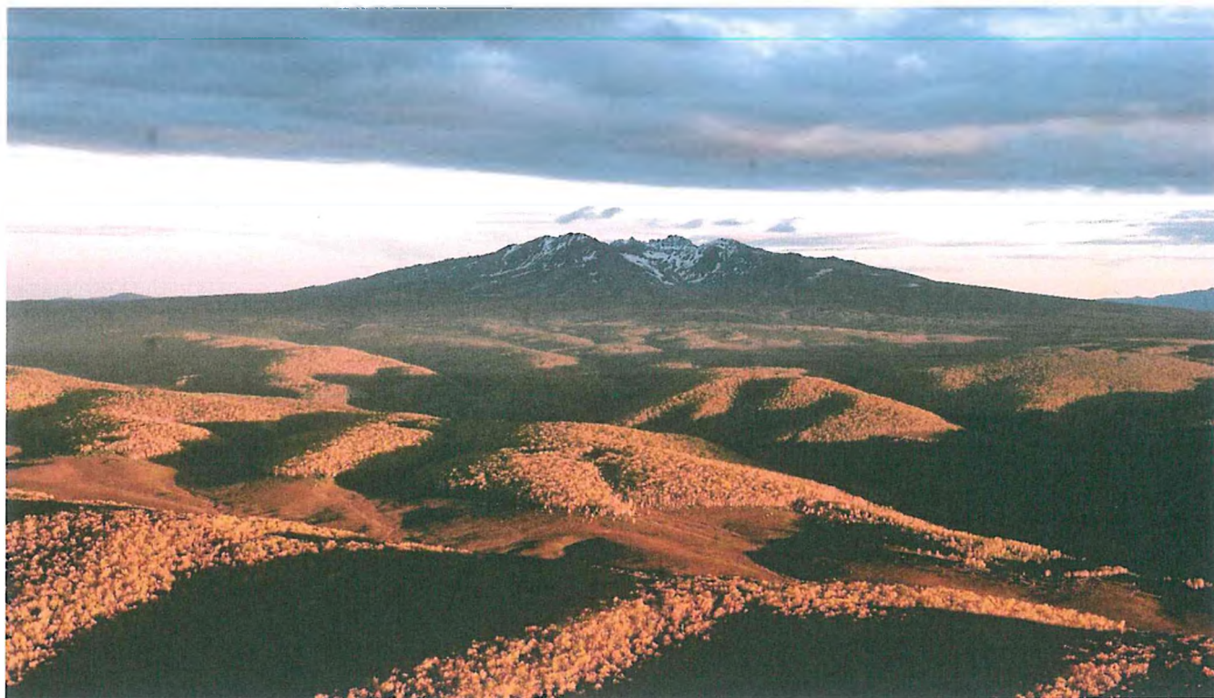
1. Вулкан Семячик (Зубчатка) на закате.