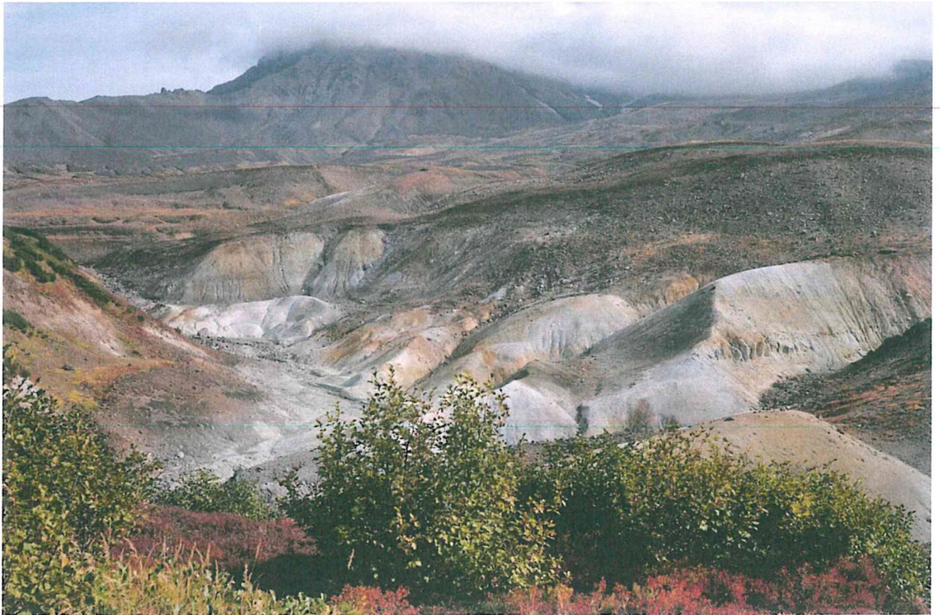
3. Панорама Долины смерти.