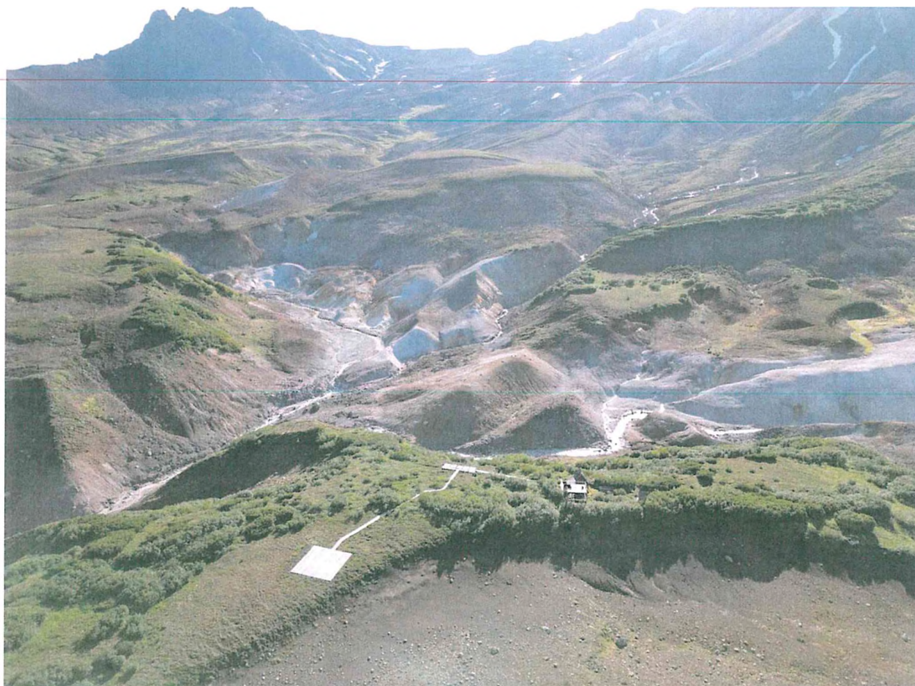
5. Панорама Долины смерти (съёмка с БПЛА).