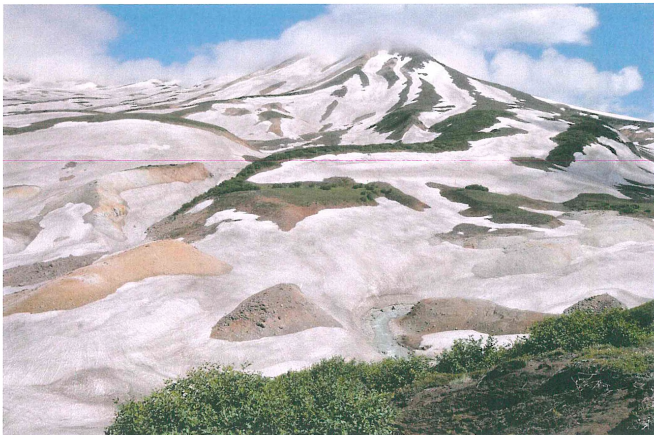
2. Панорама Долины смерти.