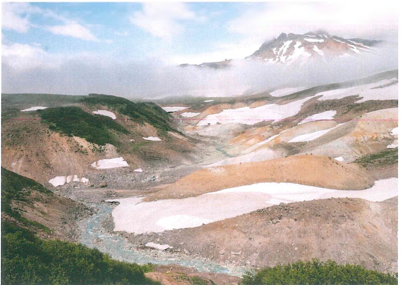
4. Панорама Долины смерти.