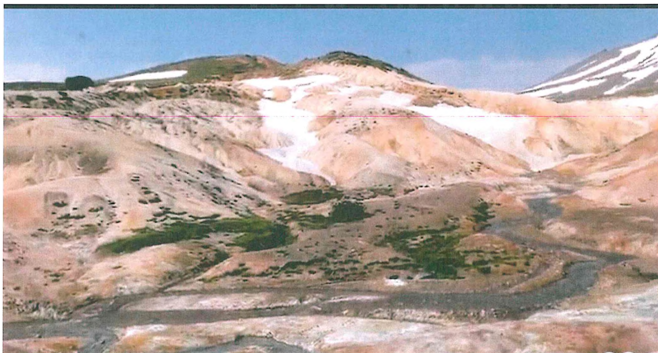
2. Долина смерти.