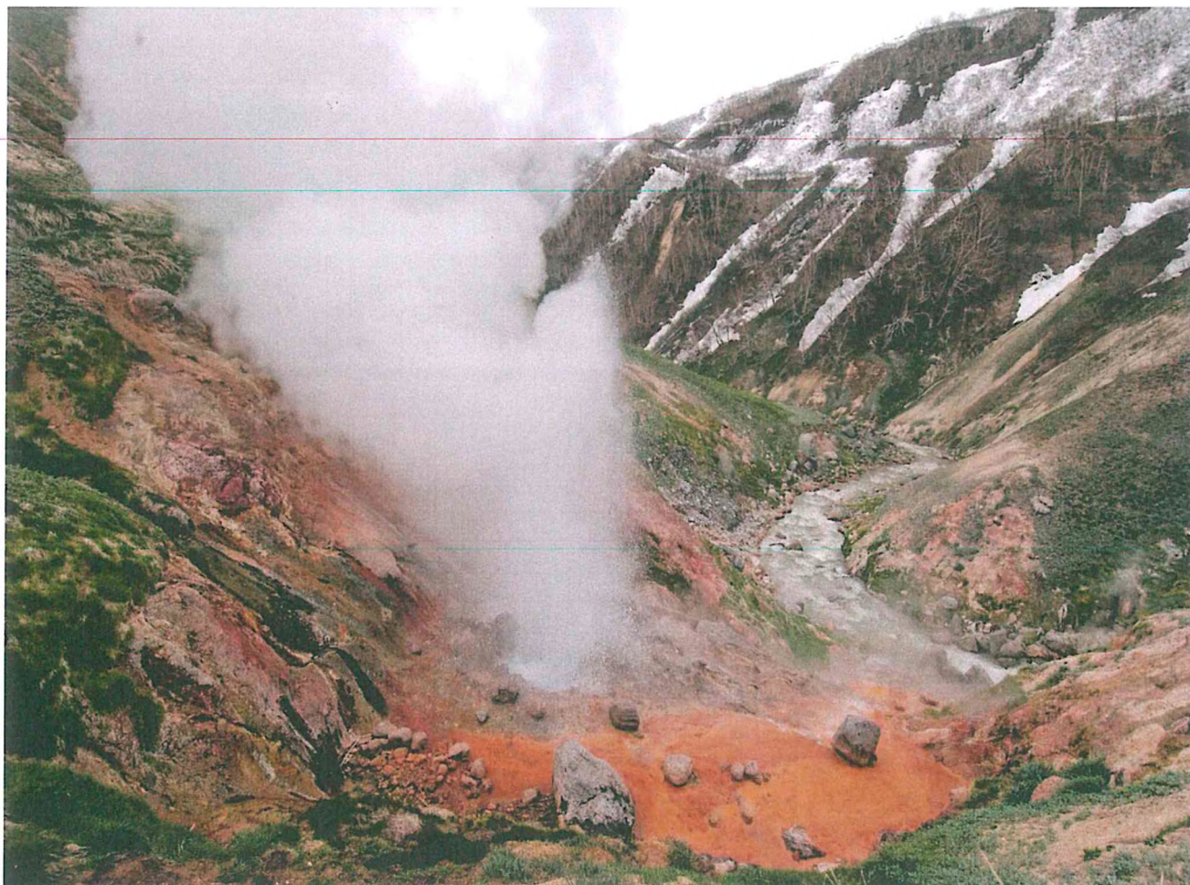
5. Каньон реки Гейзерная.