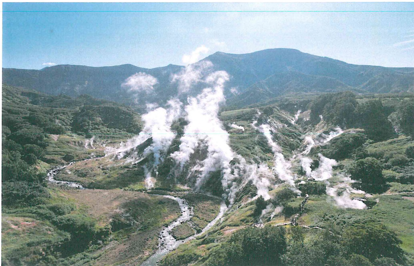
1. Долина гейзеров.