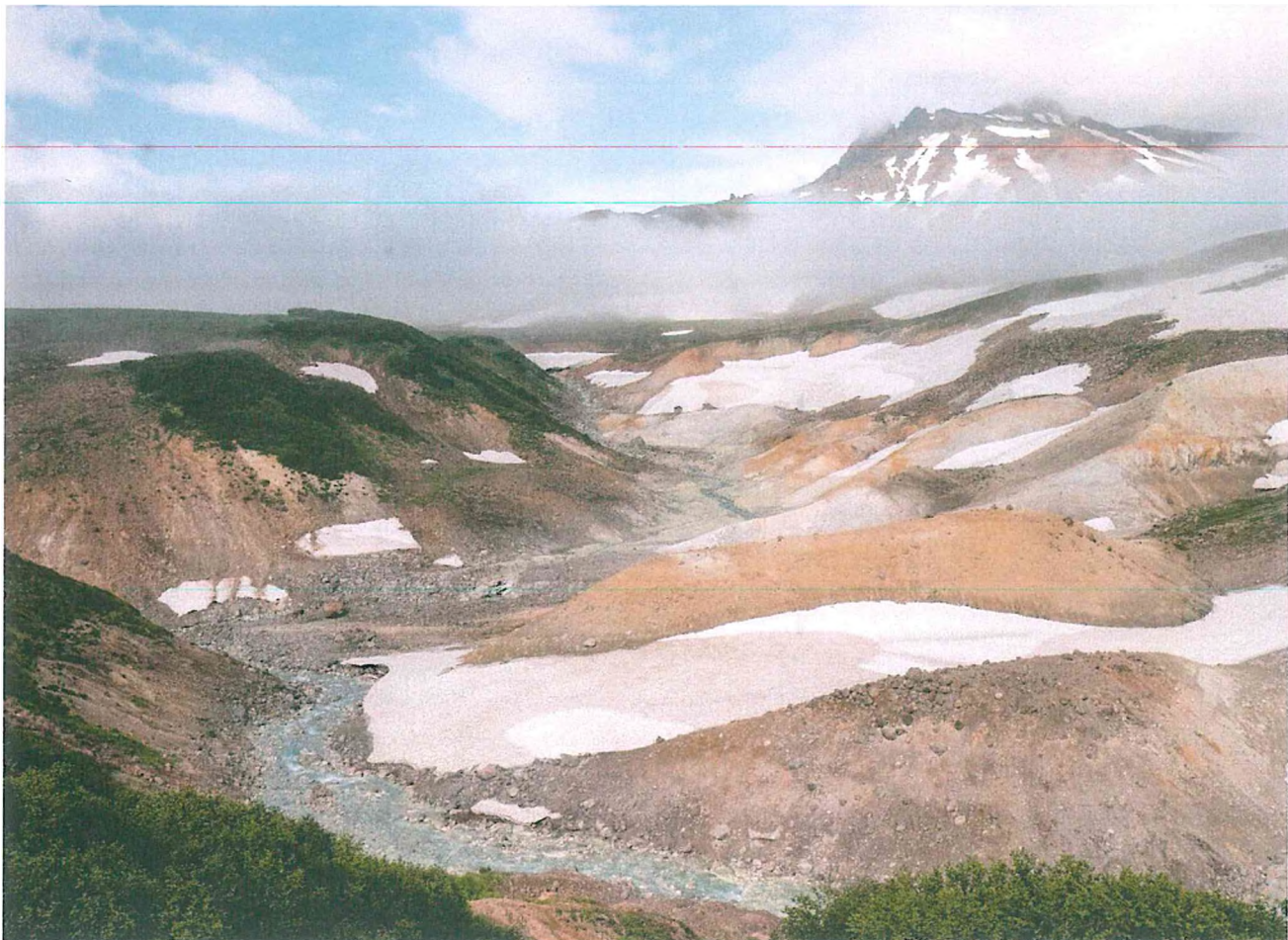
3. Долина смерти.