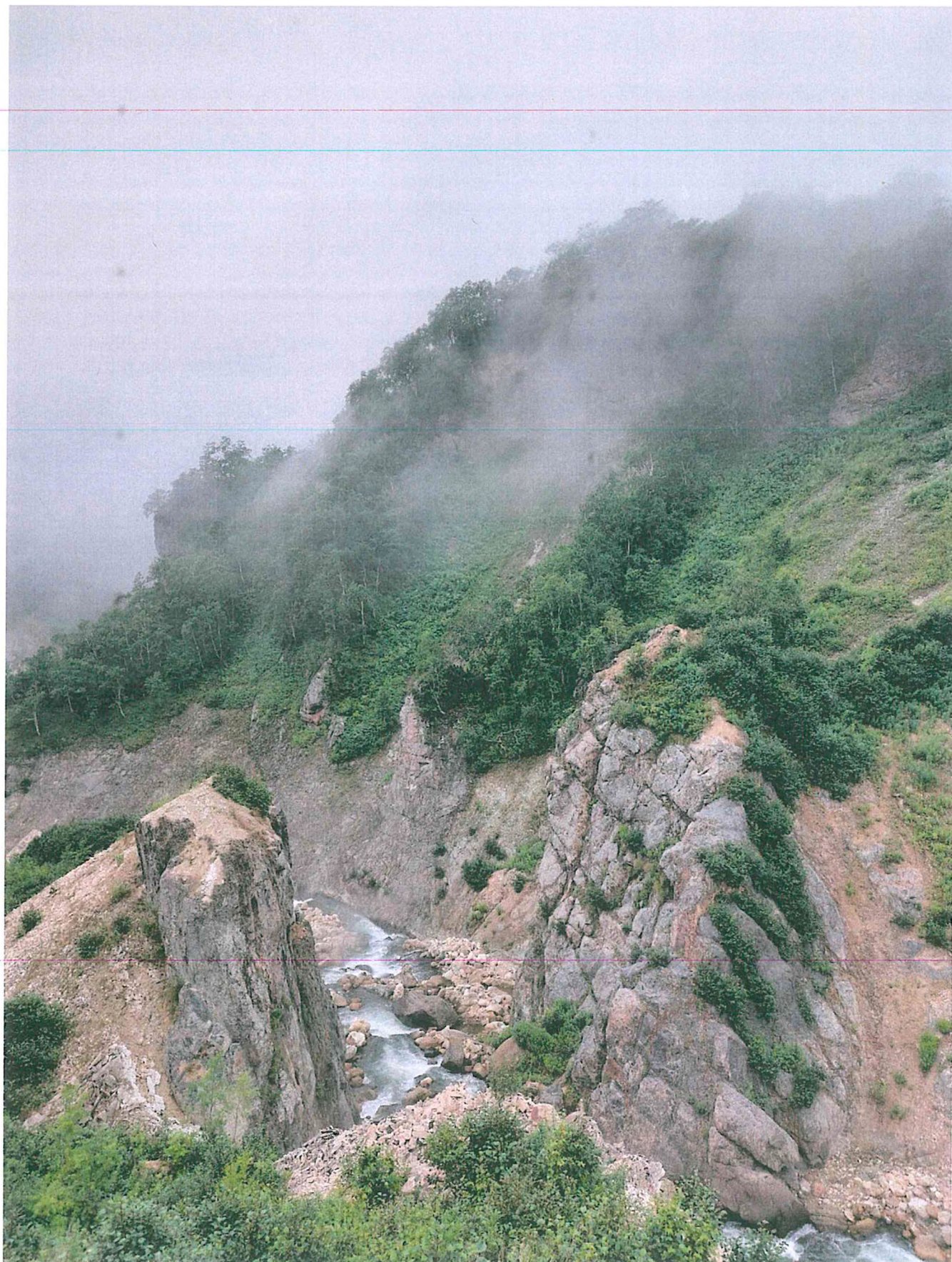
6. Скалы Триумфальные ворота.