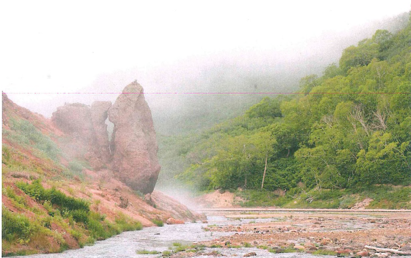
4. Долина гейзеров.