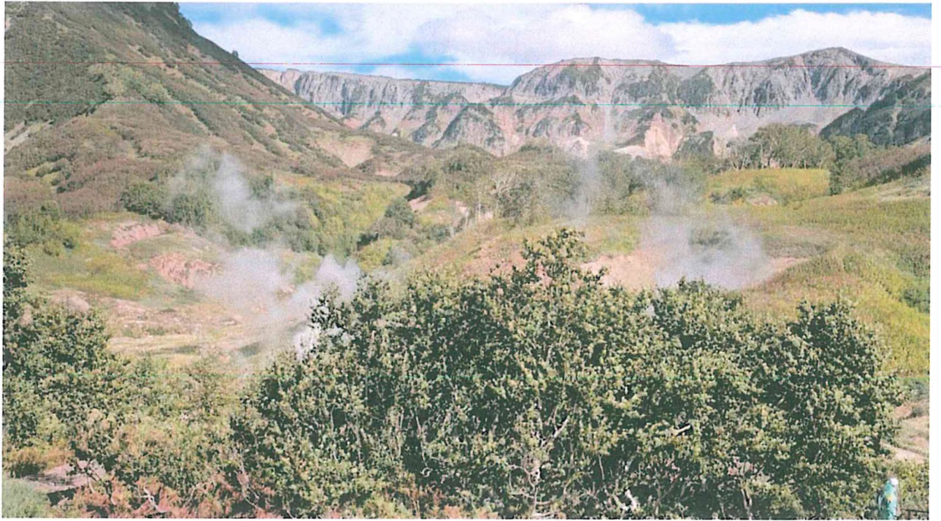
5. Панорама Долины гейзеров.