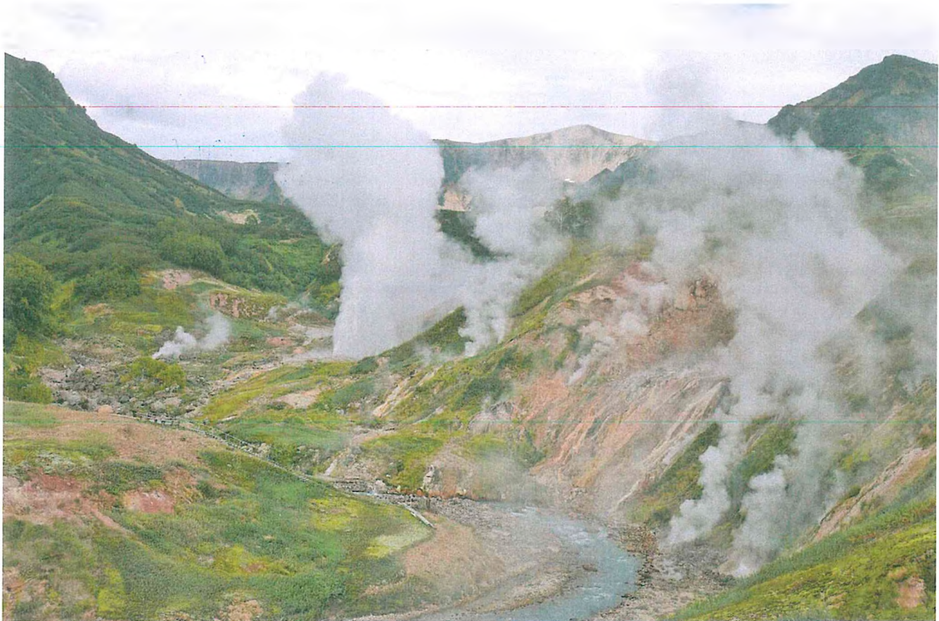
3. Каньон реки Гейзерная.