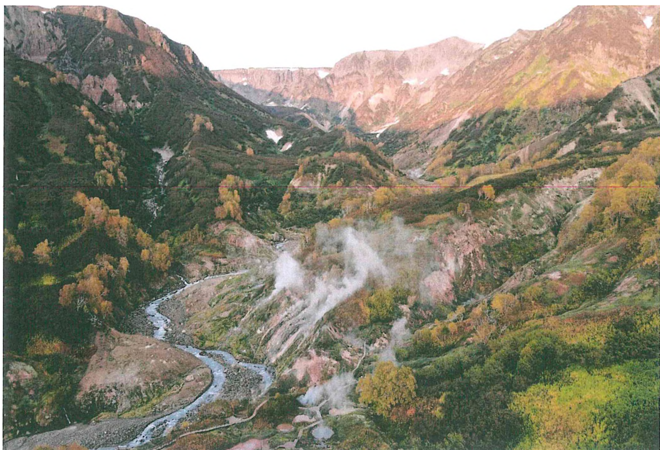
4. Долина гейзеров (аэрофотосъемка).