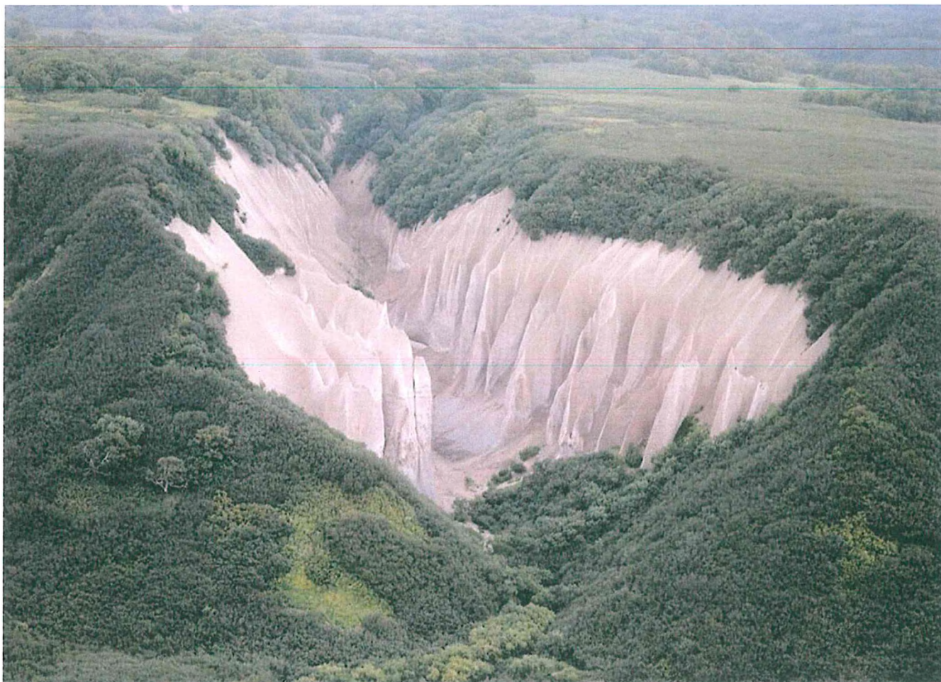
5. Пемзовые скалы Кутхины баты (съемка с БПЛА).