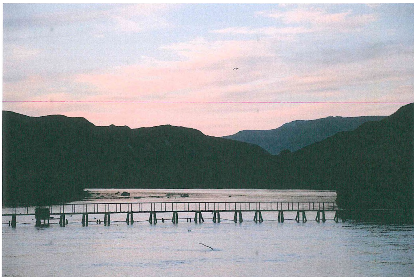
4. Мост – рыбоучетное заграждение через реку Озерная.