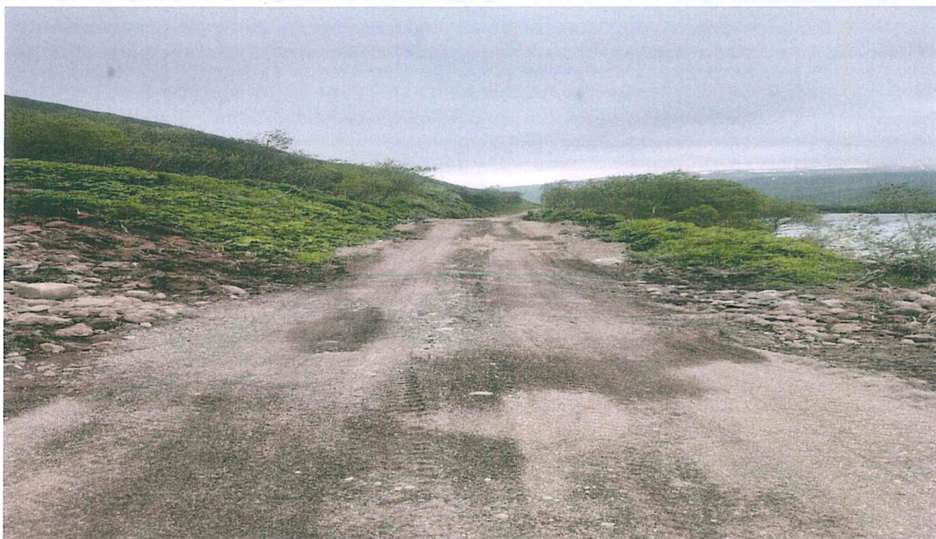
1. Грунтовая дорога вдоль реки Озерная.