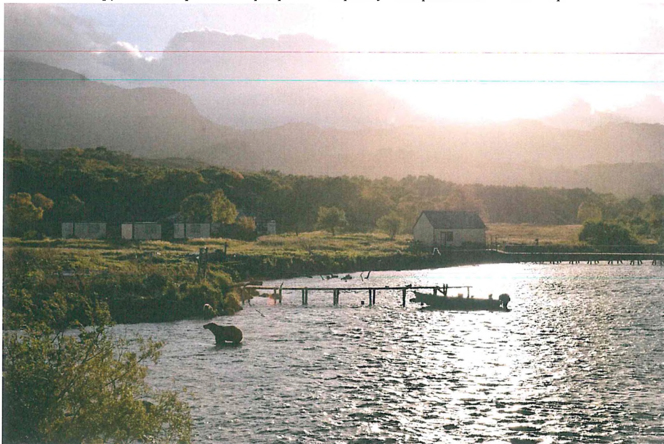
3. Пункт «КамчатНИРО» (река Озерная).