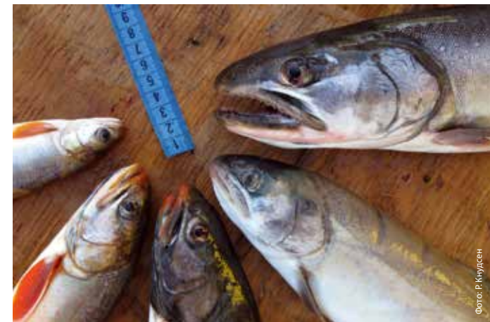
Пять форм гольцов, обитающих в Кроноцком озере

На сегодняшний день из бассейна оз. Кроноцкое описано 5 форм гольцов. В процессе эволюции они освоили разнообразные пищевые ниши, выработав различные адаптации, необходимые для эффективного потребления ресурсов. Три формы (длинноголовые, носатые и белые гольцы) ведут проходной образ жизни: нерест происходит в реках бассейна, а нагул – в озере. Длинноголовый голец является специализированным хищником, населяет обширные открытые пространства озера. Его основной объект питания – планктоноядная кокани. В отличие от длинноголовых, носатые гольцы ведут вполне мирный образ жизни, населяют мелководные прибрежные участки, питаются личинками насекомых и донными беспозвоночными. Белый голец не имеет узкой пищевой специализации: молодые особи питаются беспозвоночными, а крупные особи ведут хищный образ жизни. Помимо трех проходных форм в озере недавно были обнаружены две новые глубоководные формы: большеротые и малоротые гольцы. Их нагул и нерест происходит непосредственно в озере. Большеротые гольцы специализируются на питании