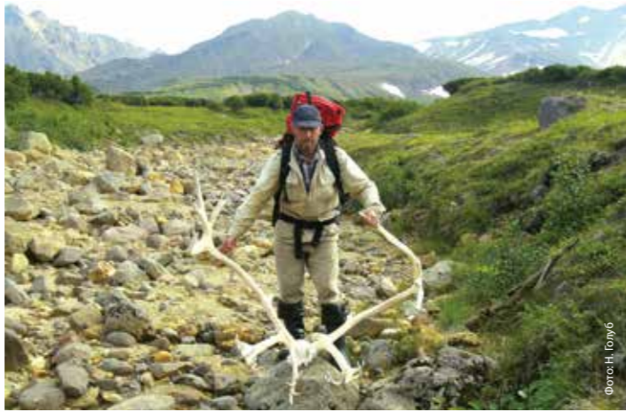
Рога крупного самца камчатского северного оленя, погибшего от волков на склоне влк. Гамчен

Основными причинами сокращения численности является человеческий фактор: неконтролируемый промысел животных в течение всего зимнего периода, интенсивное развитие домашнего оленеводства в местах зимовок диких оленей, уничтожение зимних пастбищ и фактор беспокойства в основных станциях обитания вида.