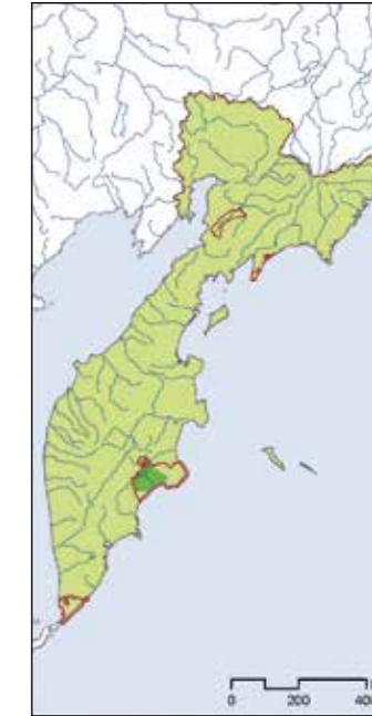
Распределение диких северных оленей на полуострове по результатам авиачетов 2002 года.

Как показали исследования, с каждым годом сокращается количество животных, откочевывающих на сопредельные территории. Ранее, на этих тундрах более 20-летних велся выпас домашних оленей. И потребуются годы для восстановления нарушенных чрезмерным выпасом домашних оленей пастбищ. Именно этот фактор, наряду с браконьерством, в итоге привел к тому, что дикие северные олени «лишились» лучших участков зимних пастбищ, где находили корма при многоснежных зимах. При этом при неблагоприятных погодных условиях небольшие табуны оленей, как и в прошлые годы, продолжают покидать территорию заповедника, традиционно откочевывая на тундры Жупановских долов и склоны Валагинского хребта, где подвергаются преследованию и браконьерскому отстрелу.